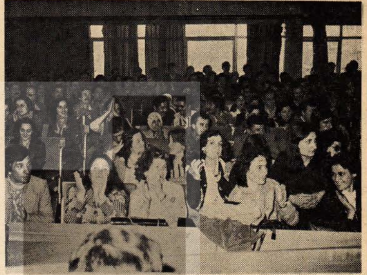
9 Nisan'da toplanan Temsilciler Meclisimiz, ilkeli ve disiplinli birliğimizi bir kez daha gösterdi.

İlkeli ve disiplinli birliğimizi pekiştirelim.